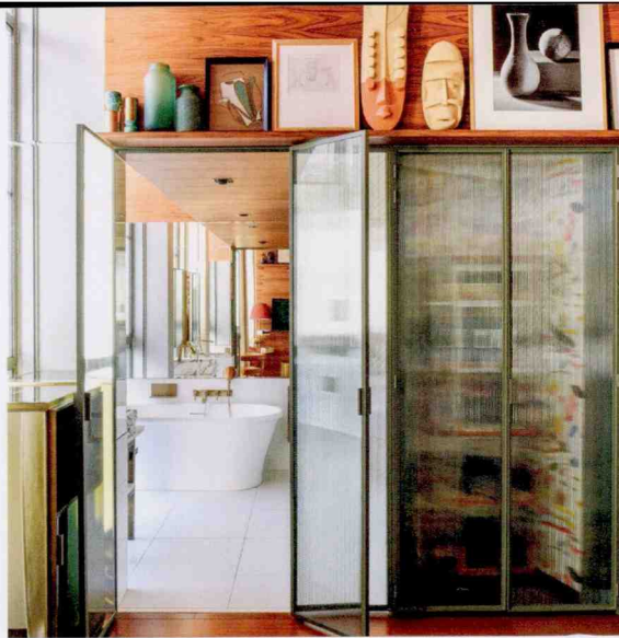
Als wäre man zu Gast im Haus eines Sammlers – Luxuszimmer im Hotel Brach.