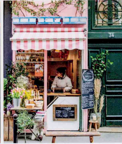
Superfoods vom Feinsten: La Guinguette d'Angèle.